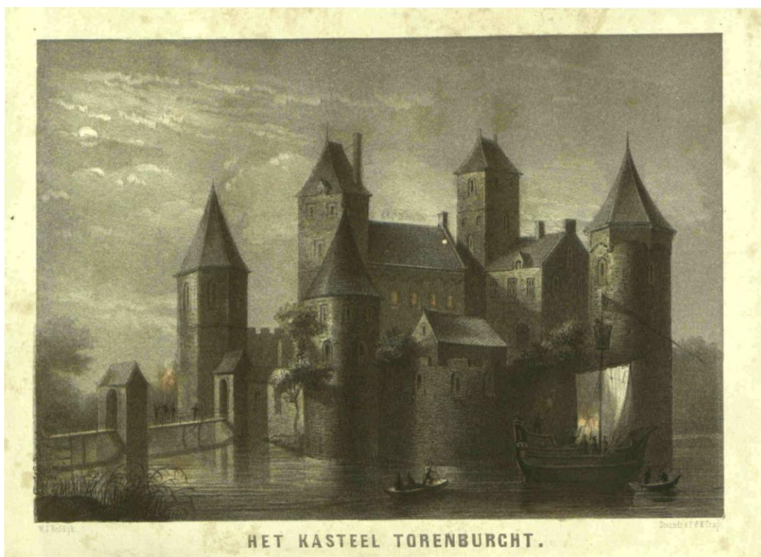
Een fantasetekening van het kasteel de Torenburg in welstand door W.J. Hofdijk